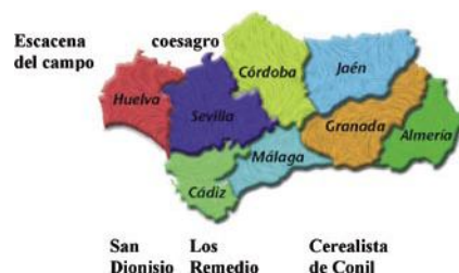
Distribución de las cooperativas participantes de Agrovegetal

empresa, adquiriendo así unos beneficios económicos, que repercuten de forma directa sobre sus socios, financiando nuevos proyectos de investigación y desarrollo.